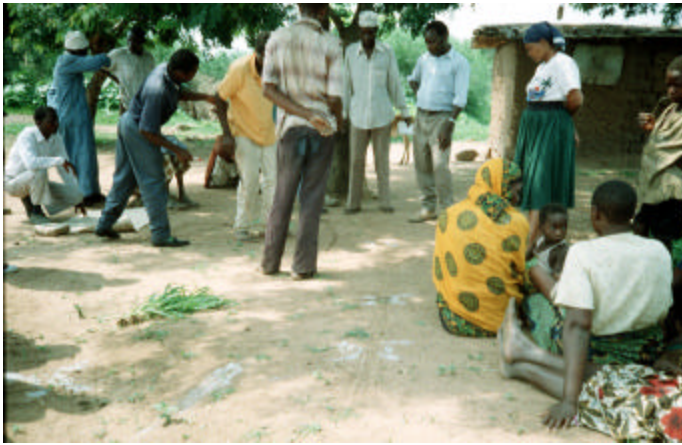
Mipango ya Kuendeleza Kilimo Wilayani lazima ianzie Vijijini

Chini ya uongozi wa Sekretariati ya Programu, timu ya wataalamu iliundwa Novemba 2004, na kufanya mashauriano na wadau wa sekta. Taarifa yake ilitoa mapendekezo kwamba kuundwe chombo cha serikali na wafadhili cha kusimamia michango ya kuwezesha kuendeleza uwekezaji na utoaji huduma wilayani kwa kuzingatia sera za serikali za utoaji madaraka katika Serikali za Mitaa.