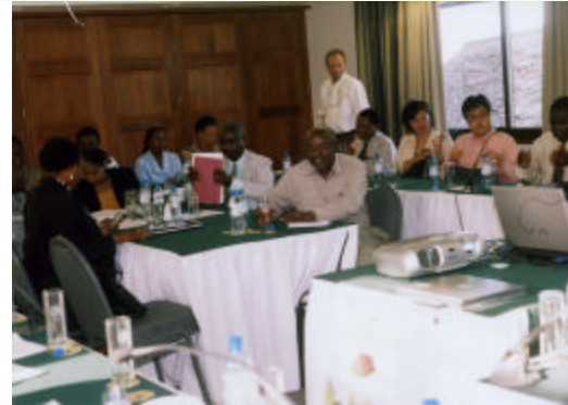
Wadau (wakurugenzi wa sekta, sekta binafsi na wafadhili) wakiwa kwenye kikao cha kupanga mipango na mikakati ya kutumia mtazamo mpana wa sekta ya kilimo