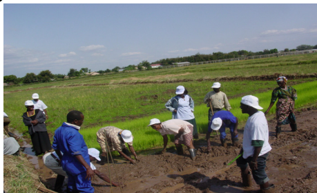
Wakulima wakishiriki mafunzo kwa vitendo

Mradi wa KATC awamu ya pili unasisitiza uwiano sawa wa kijinsia kwa washiriki wa mafunzo y o t e